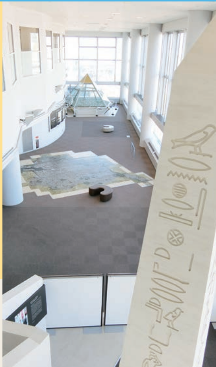
常設展示コーナー