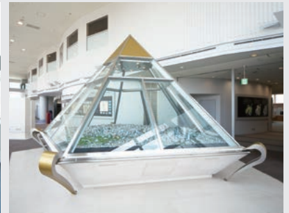
常設展示コーナー (2010(平成22)年3月)