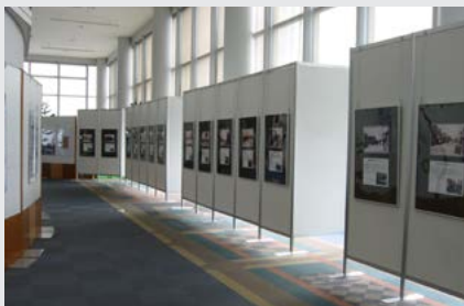
写真でつづる昭和初期の名古屋 (2004(平成16)年9月開催)

企画展示コーナーにおいて、名古屋都市センターが主催して開催した様々な企画展示の歴史を振り返ります。併せて企画展開催当時に紹介したパネルの一部も展示します。