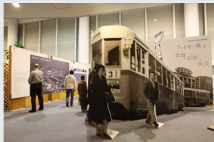
フォトモで甦る金山の記憶と風景 (2009(平成21)年3月開催)