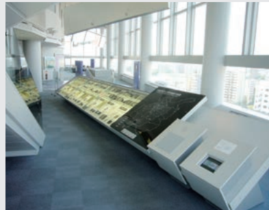
常設展示コーナー (1999(平成11)年3月)

開館当時の展示からリニューアルを経て現在に至るまでの常設展示コーナーの変遷をそれぞれの概要と写真で紹介いたします。また、開設当時に紹介されていた映像の一部も紹介します。