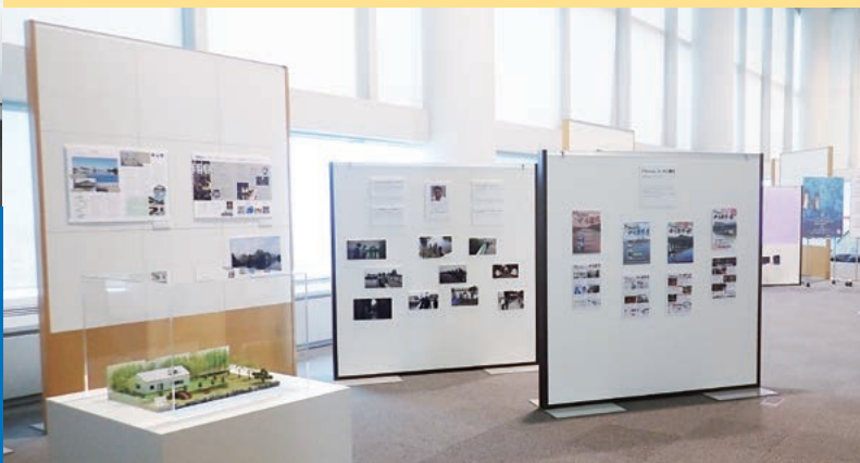
企画展示コーナー