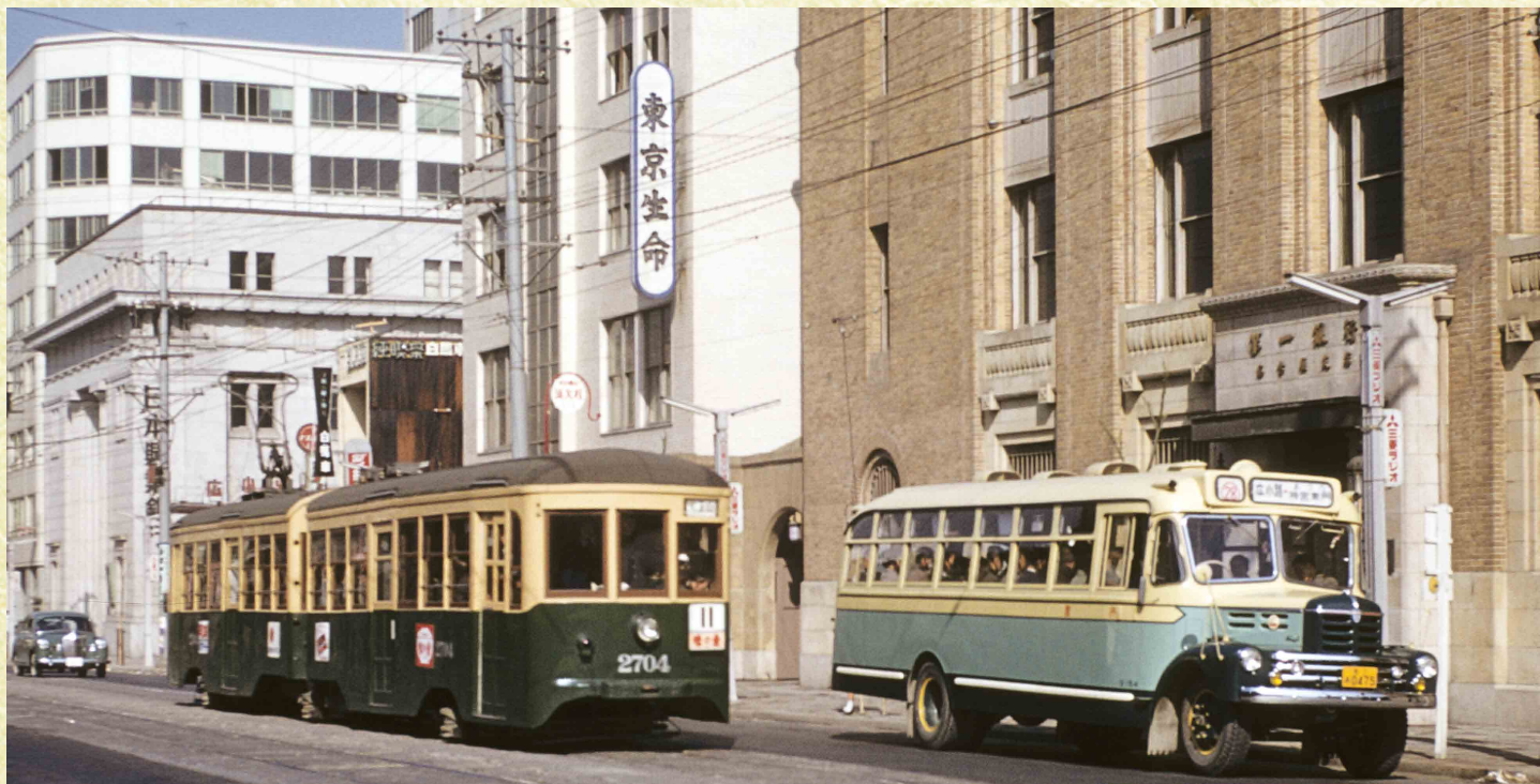
1957-4 納屋橋東一伏見通