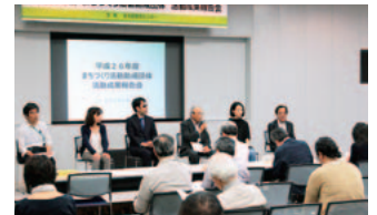
活動成果報告会の様子

後半は、まちづくり活動団体からの活動成果発表が行われ、各団体ごとに個性的で魅力的なまちづくり活動の成果が発表されました。