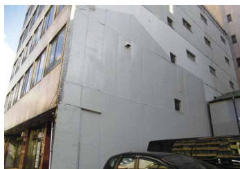
壁画制作する建物

まちに点在する短期的な空きスペースを利用した「長者町スタジオ」「長者町アーティストインレジデンス」「長者町プラットフォーム」を軸に拠点整備を行います。可動式の「案内看板」の制作、オープンスペースが全くないこの界隈に歩行者天国や各種イベント時にも使用できる「ベンチ」の設置、あいちトリエンナーレ2013をまち全体で盛り上げるための「壁画制作」の3つの整備を対象とします。