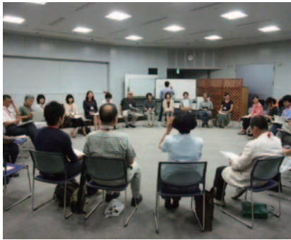
活用事例について発表の様子

ケーススタディ編では、平成22年に開催された名古屋市と名古屋港管理組合が主催した「中川運河再生に向けたワークショップ」を事例として紹介し、ファシリテーターやグラフィッカー役を追体験しました。その後、グループワークの進行や役割を検証しながらふりかえり、意見交換しました。