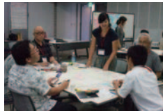
ワークショップの様子