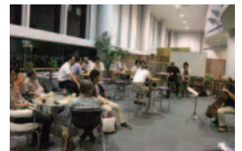
チェロ演奏の様子