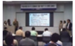
プレゼンテーションの様子