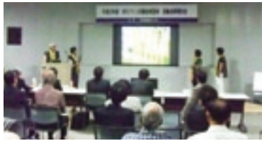
【第1部】活動成果報告の様子

第1部は「活動成果報告」、第2部は「ポスターセッション」を行い、各団体と参加者が交流・情報交換を図る場となりました。