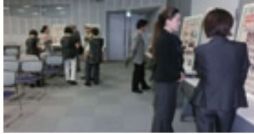
【第2部】ポスターセッションの様子