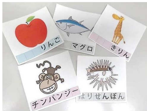
仲間集めゲームで使用した名札

進行役のまちづくりびとの進行により、初対面の受講生同士の緊張をほぐすとともにグループ分けを行うアイスブレイク「仲間集めゲーム」を行いました。受講生へ事前に渡してある名札に描かれた様々な絵を見て仲間を探すというものです。参加者全員が一斉に互いの絵柄を見せ合いながら、乗物グループや料理グループなど同じカテゴリの仲間を探し出しました。5つのグループをつくる予定が8グループになってしまいました。しかし、ここから5グループに分かれる仕掛けがありました。「桃（もも）」「鯛（たい）」「象（ぞう）」と同じ文字数の人達で集まると、見事5グループになりました。みなさんの楽しく参加され緊張がほぐれたようでした。