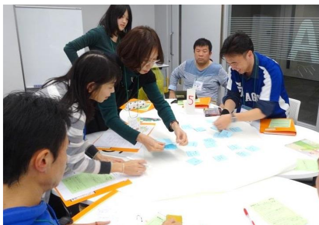
グループ紹介シート作成の様子

事前に渡された自己紹介カードへ氏名や幻燈会を見て共感したポイント、講座へ参加した理由などを記入し、1人1分でカードを利用して自己紹介をしました。グループファシリテーターのまちづくりびとは、受講生が自己紹介をした際に出たキーワードをふせんに書き出し、そのキーワードを活用しながらグループの紹介シートを作成し、意見を整理しました。