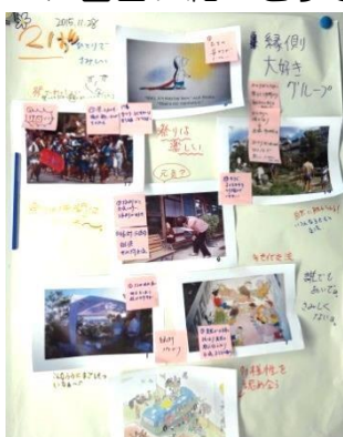
縁側大好きグループのワークショップ成果

ワークショップにより作成したポスターの発表が行われました。即興演劇やポスターに面白い細工をするなど、個性あふれる発表となりました。