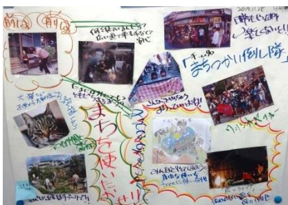
まちつかい倒し隊のワークショップ成果