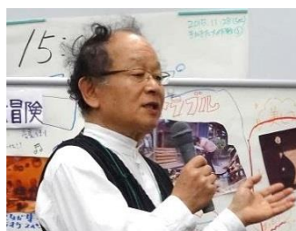
延藤さんがまとめたまちづくりのキーワード