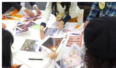
ポスター作成の様子

ビジョンゲームとは、お気に入りの写真を1人1枚選択し、テーマに対してグループの受講生それぞれの写真を合せて1つのストーリーをつくってくというものです。これはまちづくりを進める際に行う手法の1つで、各々の考えをまとめていく合意形成を体験することが出来ます。