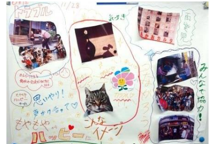
もやもやハッピーのワークショップ成果

まちづくりのヒントや北区の魅力を再発見して、まちのもやもやをすっきりしてハッピーになりたいグループ。ビューティフルでメロウでスロウな場所をつくり、まちの魅力が再発見できて、もやもやしたトラブルが解決してハッピーになるまちがいいな。