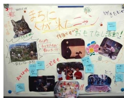
きたにゃんのワークショップ成果

「地域活動」「北区」「絵本」などに関心を持ったメンバーが集まったグループ。まちのお年寄りや子ども、いろんな人達が、どこでも楽しく集まれるまちがいいな。