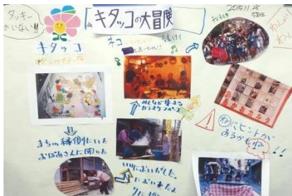
5班じゃないよ、ライスだよのワークショップ成果