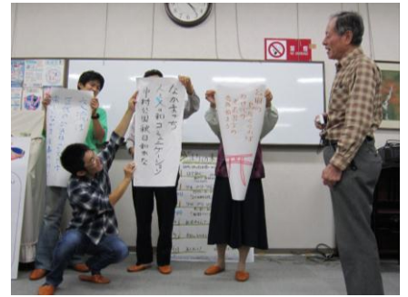
アホくさトロくさドンくさ みんなとつながる なかむら WA・WA・WA の会