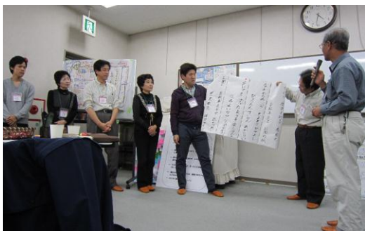
優しさの天使達～天道虫とおとよさん