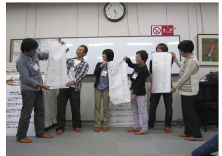
ひでっち きよっち なかまっち