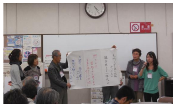
中村公園 いと 愛し隊