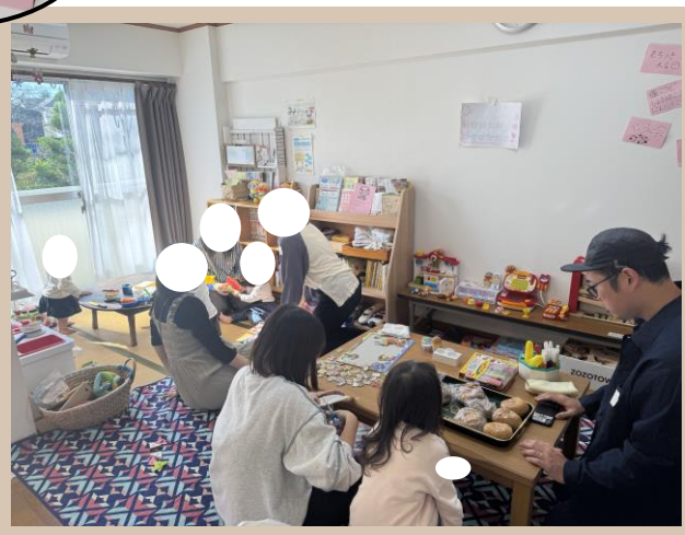
マンションの一室に、キッチン、子どもの遊び場、テーブルなどが並んでいます