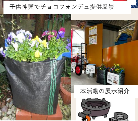
土のう袋で花の苗を栽培