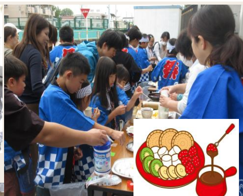
子供神輿でチョコフォンデュ提供風景