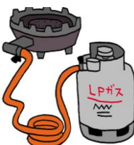
災害に強いLPコンロ