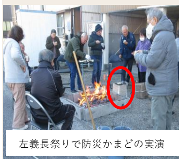
左義長祭りで防災かまどの実演