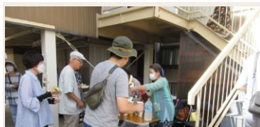
防災訓練でホットドック提供風景