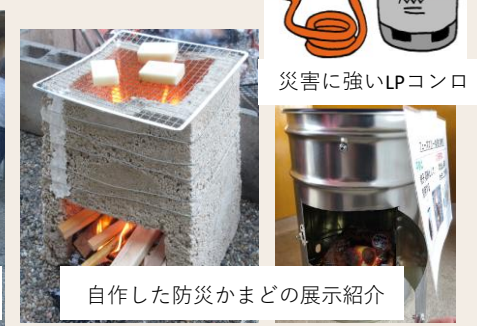
自作した防災かまどの展示紹介