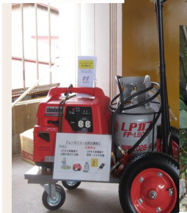
LPガス式発電機と台車の展示紹介