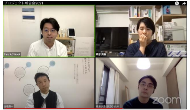
2021年3月22日〔月〕実施の オンライン報告会の画面

また、今回の活動のなかで、ウェブサイトの公開を行うことができ、昨年度からの記録も含めて、映像作品を公開することができた。