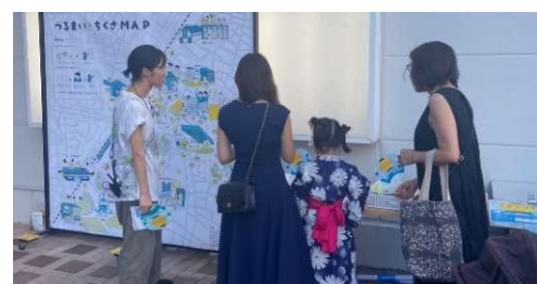
ミズマツリ時の様子