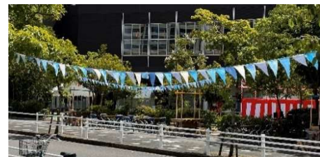
歩道を装飾するガーランド