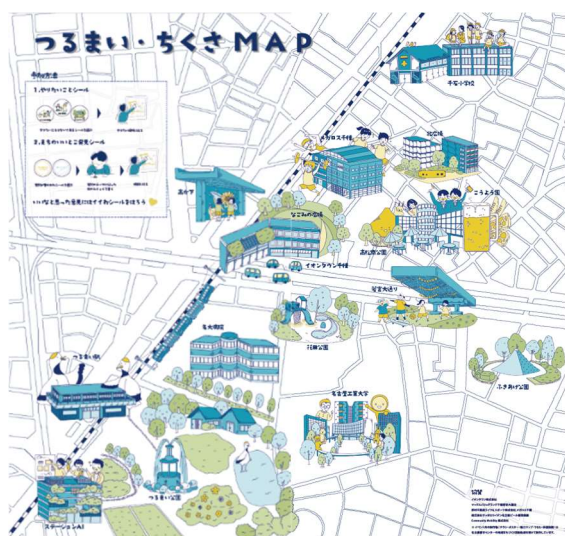
まちの魅力マップ

まちの魅力を地域の方から集めるために参加型のMAPの展示を、夏の地域連携イベント（ツルマイ・チクサ ミズマツリ）と千石小学校区主催のふれあい祭りでおこないました。鶴舞・千種エリアのMAPを作成し、まちでやりたいことやおすすめスポットを来場者にシールで貼っていただき、地域住民のまちに対する思いを集めました。