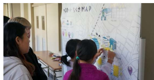
ふれあい祭り時の様子