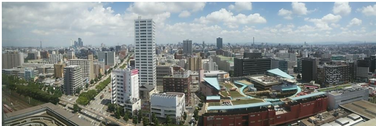
特別会議室からの眺望