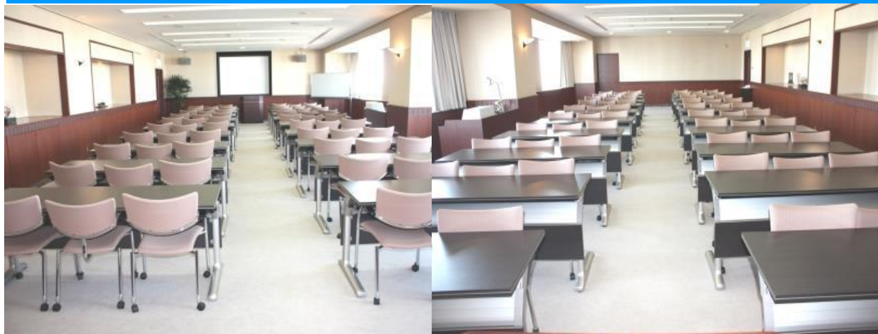
特別会議室の室内