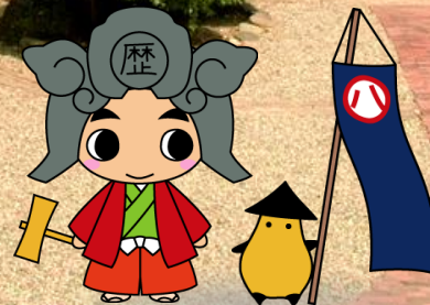
名古屋市歴史まちづくりPRキャラクター 歴まちくんとおとも

ピンバッジの売り上げは 「なごや歴史まちづくり基金」に 積み立てられ、歴史的建造物の 保存活用を行う事業への支援に 使われます!