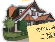
文化のみち 二葉館