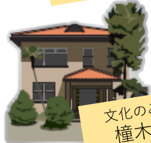
文化のみち 榎木館