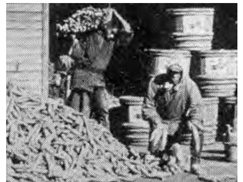
明治時代末の御器所沢庵漬の作業風景

現在では、区画整理や市電・地下鉄の开通によって御器所周辺は住宅地となり、残念ながら当時の様子を思い起こすことはできません。