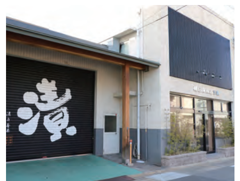
今も御器所で作づく漬物製造(昭和区御器所三丁目)