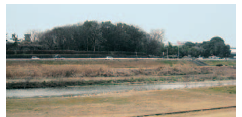
守山区から見た長母寺付近の緑