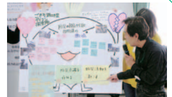
昨年度の入門編の様子