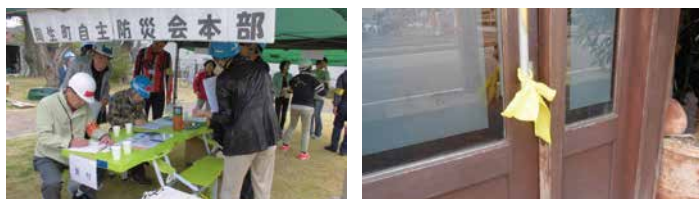
安否確認の報告の様子

今回のまちづくり活動助成では、①風呂桶の貯め水や街角に置いた大型ゴミバケツを利用した防火水槽の水をバケツリレーしての消火訓練。②山登りの各種のロープワークを利用したがれき除去などの救出救護訓練や簡易担架・松葉杖の作製と搬送訓練。③周辺の町内やマンション住民等と行う防災勉強会と訓練。④「幸せの黄色いリボン」「笛」を用いた安否確認訓練。⑤地域の絆づくりを兼ねた炊き出し訓練。⑥全戸に対して防災減災対策の実施状況調査を行います。