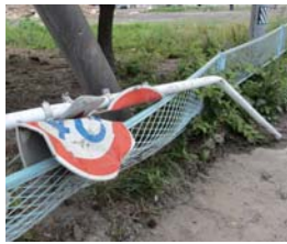
津波により変形した標識