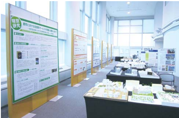
建築系愛知8大学共同企画展 展示の様子

今回の企画展では、平成22年度の名古屋都市センターの研究成果をパネル展示と合わせて、愛知県内の建築系8大学の学生が製作した都市型住宅等の模型を展示し、名古屋のまちづくりの課題やまちの魅力についてご紹介いたしました。