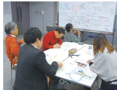
ファシリテーター&ファシリテーション・グラフィック体験