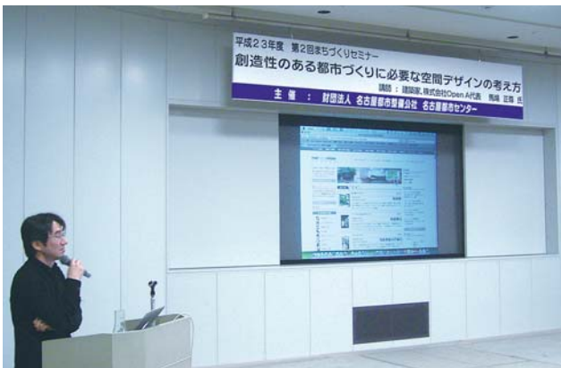
平成23年度 第2回まちづくりセミナー 講演の様子