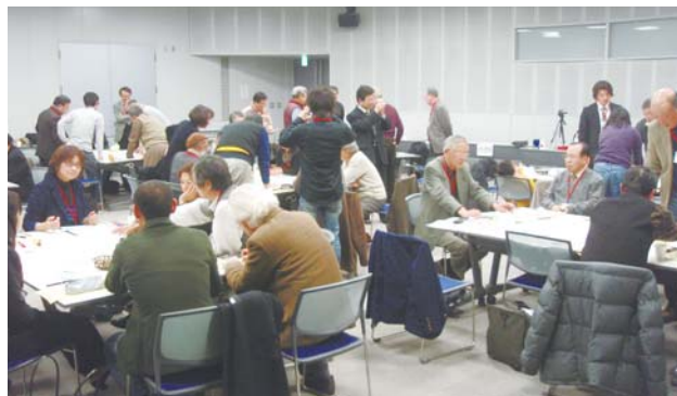
まちづくり活動団体交流会 開催

まちづくり活動助成を受けている市民団体を中心に、様々な分野で活躍している団体の交流会を毎年開催しています。今回は、27市民団体の46名、地域の“まちづくりびと”養成講座の修了生8名も加わり、まちづくり活動団体の自己紹介、交流・人材育成をテーマにしたグループワークを行いました。今回の交流を通じて、今後のまちづくり活動の発展を期待しています。