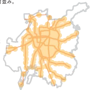
駅そば生活圏で都市機能と居住機能を充実させていくゾーンイメージ。