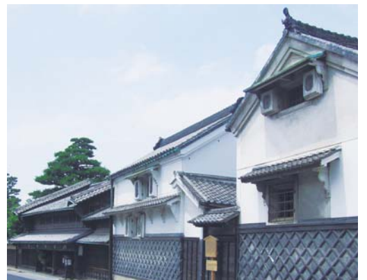
名所づくりによる都市力の向上もめざしている。写真は旧東海道の有松の町並み。