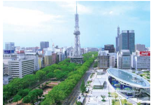
都心機能の強化とともに、拠点間連携も重要なテーマ。

このマスタープランの対象区域は名古屋市域を基本とするものの、周辺市町村や、名古屋大都市圏の各都市との交流・連携も視野に収めています。また2025年ごろを境に人口が減少基調となることを想定。これらを踏まえ約20年の長期的な見通しのもとに、2020年を目標年次としています。