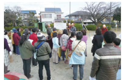
防災マップ作成調査

平成22年度のまちづくり活動助成では、①防災啓発への住民交流促進活動、②建築協定区域拡大への啓発活動、③日常生活での防犯啓発活動などを実施し、活動の範囲を広げました。