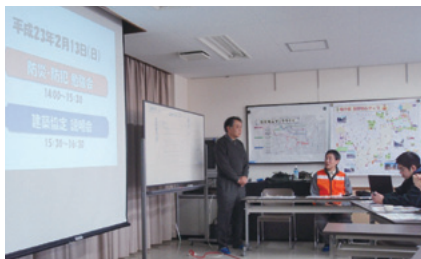
防災啓発の勉強会

緑区鳴子町に居住する近隣住民で構成するグループであり、当初は「まちづくりを話し合う会」という名のもとに、平成19年12月に活動をスタートしました。それまで面識がなかった近隣住民が話し合う場ができたことを契機として、自然な流れの中で、徐々に仲間が増えてきました。