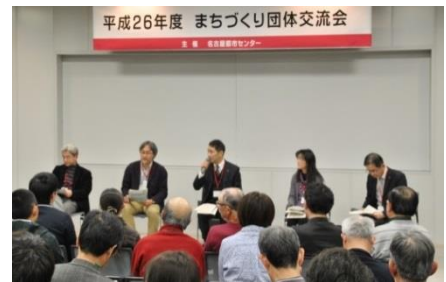
第2部 委員によるディスカッションの様子

初めての方にはやや難しかったようですが、一生懸命取り組み、面白い意見がたくさん出されていました。そうして集めた意見を模造紙に集約してアイデアのグルーピングを行い、具体的な提案活動の内容をまとめます。