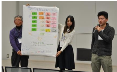
第1部 グループワークと発表の様子

第1部のまちトーク「私たちのやっているまちづくり」では、参加者が取り組んでいるまちづくり活動やまちづくりに対するイメージを、言葉とイラストが描かれたカードを使って意見交換するグループワークと発表を行いました。