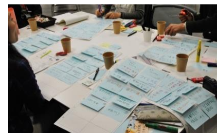
第2部 グループワークの様子