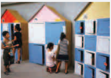
子どもたちに人気のロッカー