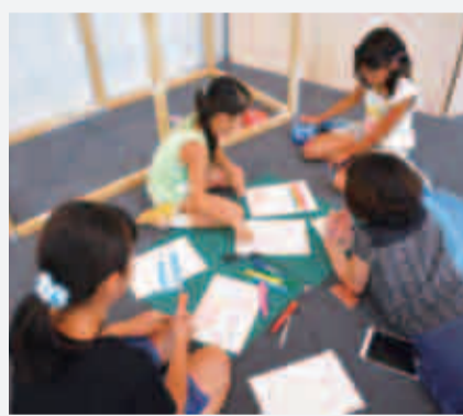
現場での打ち合わせはいい案ができる

ストリートファニチャー WSでは、外側に「顔出し看板」と「案内板」、そして今年のだがねランドの大きな特徴となった大研修室内の設えであるまち並みに見立てたロッカーや商品の展示棚がつくられた。 1日限りのWSで子どももスタッフも総出で頑張ったため、気が付けば作成中の写真が無いというさびしい事になってしまった。 「顔出し看板」は、だ が ね ず み と DAS の 並 ば っ た も の で、 ま ち が オ ー プ ン し た 後 人 気 を 博 し て い た。