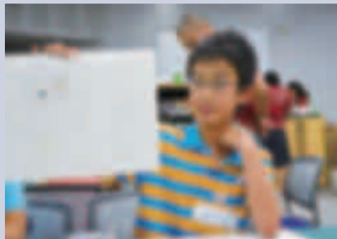
どんなデザインにするか話し合い